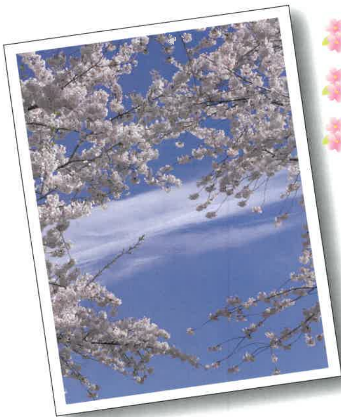
2016年度 協会長大賞作品 「桜フレーム」